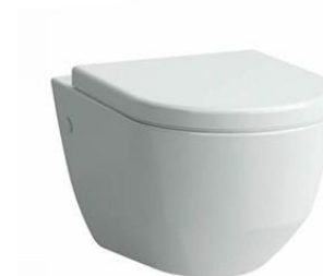
04 – WC LAUFEN P KLOZET ZÁVĚSNÝ 53 CM