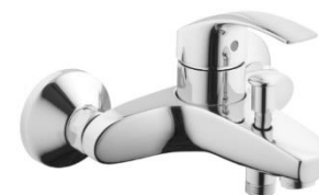
07 – BATERIE VANOVÁ GROHE NÁSTĚNNÁ PÁKOVÁ