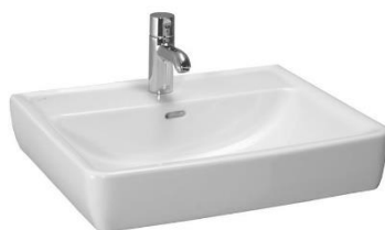
02 – UMYVADLO LAUFEN PRO A 60 X 48 CM