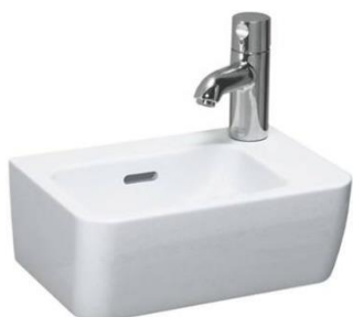
05 – UMÝVÁTKO LAUFEN LAUFEN PRO 36x25 CM