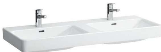
01 – DVOJUMYVADLO LAUFEN LAUFEN PRO S 120 x 46 CM