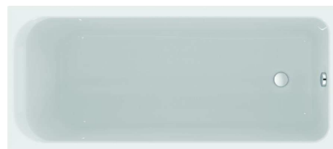
06 – VANA CONCEPT 100 AKRYLÁT NEW 180 X 80 CM