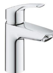
03 – BATERIE UMYVADLOVÁ GROHE