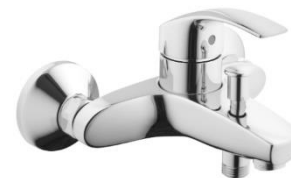
07 - BATERIE VANOVÁ GROHE NÁSTĚNNÁ PÁKOVÁ