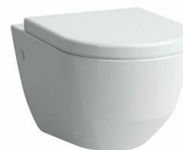
04 - WC LAUFEN P KLOZET ZÁVĚSNÝ 53 CM